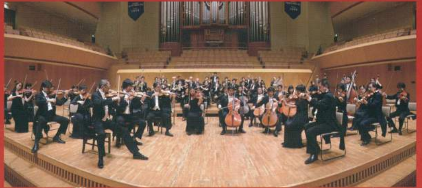
● 神奈川フィルハーモニー管弦楽団より 神奈川フィル木管五重奏団