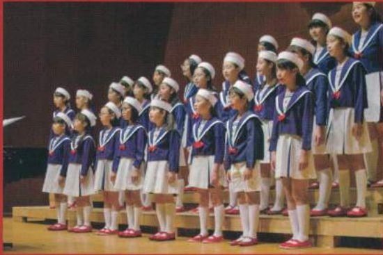
● 赤い靴ジュニアコーラス