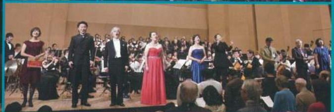
木村敬一