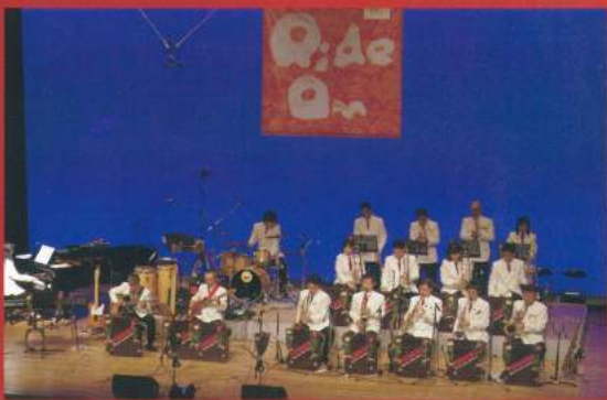
● 東芝ライドオンジャズオーケストラ

子どもたちの歌声やリコーダーアンサンブル、プロオーケストラメンバーによる室内楽、ジャズピアノ、プロ顔負けのジャズバンドによる演奏など、様々なジャンルを一度にお楽しみください。