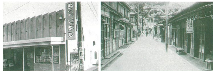
昭和30年代の「根岸シネマ」