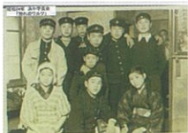
学芸会に出演した浜中の生徒

杉田劇場を借りて学芸会をやっていた浜中学校の生徒たち(昭和24年)。演劇の題名は「別れのワルツ」。このあと昭和27年にも学芸会があり、その写真も残っている。杉田劇場は昭和25年に閉館したとされているが、それは会社が倒産した年で、実際にはさらに2年ほど続いていたと思われる。