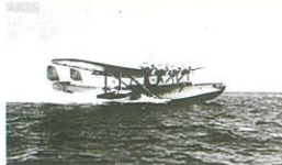
九七式飛行艇(『浜・海・道II』より)

飛行艇を飛ばしていたのは、根岸の大日本航空だけではなく、富岡の横浜海軍航空隊も同じであった。開戦が近づくと、会社は丸ごと海軍に徴用され、名称も「横須賀鎮守府第七輸送機隊」に変更。社員は海軍嘱託となり、次第に業務は軍人輸送へと切り替えられていった。