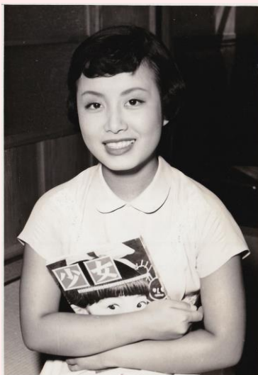
← 十代の美空ひばり → 旧杉田劇場のポスター